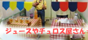
ジュースやチョコロス屋さん☆