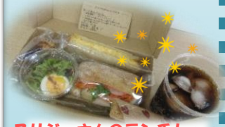
スリジェさんのランチBOX & チョロス、ジュース