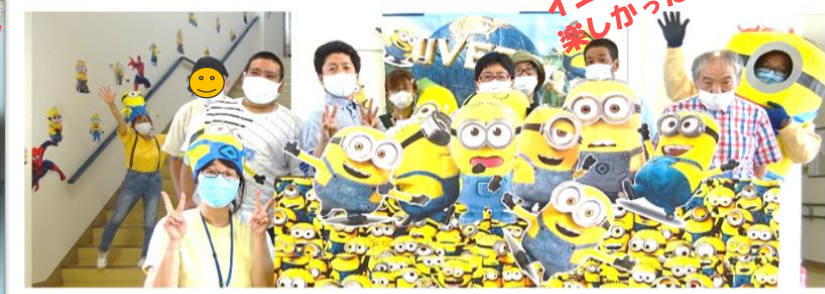
映画も満喫しました!