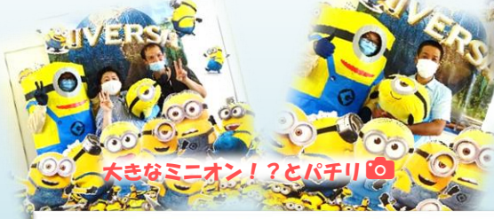
大きなミニオン!?!とパチリ!!